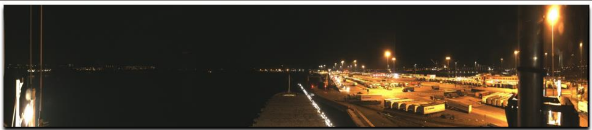
Normal Camera View